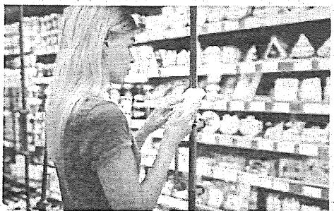
На этикетке кроме срока годности производители размещают массу другой важной информации.

Производитель также должен проинформировать покупателя, если доля генетически модифицированных пищевых продуктов (ГМО) превышает в составе изделия 0,9 процента. В России в пищевой промышленности официально разрешено применение 14 сельскохозяйственных сортов, полученных с применением трансгенных технологий. Гено-модифицированная соя — наиболее распространенная из них. Отдельные вещества могут вы-