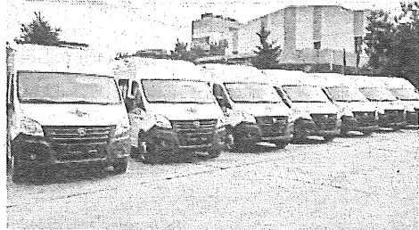
Сейчас на Кубани более 700 автомобилей скорой помощи.

поручений президента РФ за счет федеральных средств. За последние два года автопарк